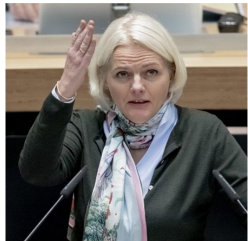
(Bild: Regine Günther gibt schon einmal die Richtung vor) (Fortsetzung folgt.)

(13.3.) Die Berliner Verkehrssenatorin Regine Günther (parteilos) (s.re.) will die Hauptstadt zum internationalen Vorbild für urbane Verkehrspolitik machen. „Unsere Vision ist es, daß im Jahr 2030 die Menschen aus aller Welt zu uns kommen, um sich anzuschauen, wie gut wir in Berlin das Mobilitätsthema gelöst haben. Wir haben den Anspruch, für Vernetzung und für neue Mobilität in eine Vorreiterrolle zu kommen“, sagte sie der "Welt". 10