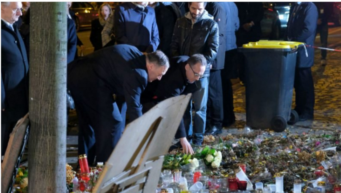
Außenminister Heiko Maas und Mike Pompeo vor dem Tatort des Anschlages in Halle.

Während des gemeinsamen Treffens zwischen den Außenministern Heiko Maas (SPD) und Mike Pompeo ging es nach einem Unfall weiter zum Tatort des Anschlages in Halle.