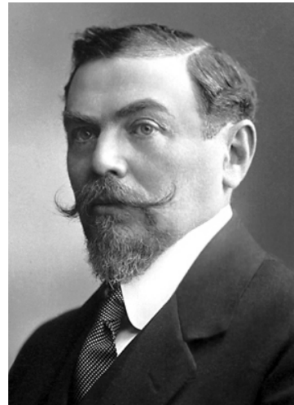
(Alfred Fried, 2 1864-1921)

Dr. Alfred Fried (s.re.), jüdischer Träger des Friedensnobelpreises und die Hauptfigur der pazifistischen Bewegung in Deutschland und Österreich, bekämpfte derweil aus dem Ausland die Reichsregierung und rief die deutschen Soldaten zur Desertion auf. Von seiner sicheren Schweizer Basis aus exportierte Fried während des ersten Weltkriegs Hunderttausende Exemplare seiner Zeitschrift „Friedenswarte“, die von kommunistischer Propaganda gegen die deutsche Mittel- und Oberschicht nur so kochte. Kurz vor seinem Tod brachte Fried 1920 sein „Kriegstagebuch“ heraus, das im Detail den vollen Umfang seiner subversiven Tätigkeit gegen Deutschland während des ersten Weltkriegs beschrieb. Fried feierte die Anstrengungen der feurigen polnischen Jüdin Rosa Luxemburg, das Deut-