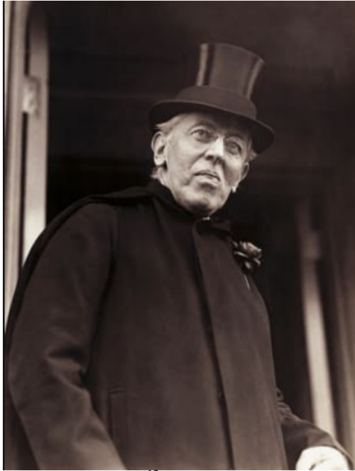
(Woodrow Wilson, 12 1856-1924)

dem Colonel die Welt verteilt hat. Trotz einiger Einwände stimmt Wilson dem englischen Außenminister schließlich zu und unterschreibt am 23. Mai 1917 das Abkommen, das seitdem vor den Mittelmächten streng geheimgehalten wird. 11 Wenig später entstand zwischen Colonel House und Lord Northcliffe der Plan, die deutsche Bevölkerung gegen die eigene Regierung aufzuhetzen und einen Keil zwischen Volk und Regierung zu treiben durch eine Unterscheidung zwischen „Volk und Militarismus“ einerseits und „Junker und Volk“ andererseits. Man beschloß, den Deutschen zu versprechen, daß sie leicht einen Frieden haben können, wenn sie sich ihrer Obrigkeit entledigen. So wurde eine Propaganda vorbereitet, die Vertrauen, Treue und Moral im Rücken der siegreichen Truppen untergraben sollte, um die Opposition zu stärken.