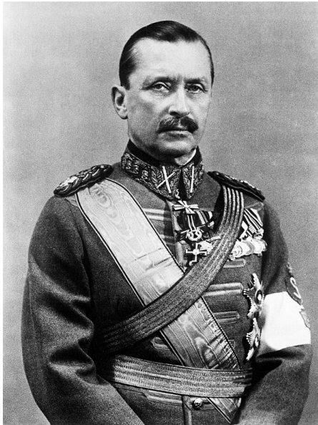
(Carl G. E. Mannerheim, 10 1867-1951)

(Weitere 1 Hinweise zum Migrationspakt-Thema: Petition zum UN-Migrationspakt: AfD-Antrag auf öffentliche Petitionsausschuss-Sitzung ohne Debatte abgelehnt. 2 Und: Sarrazin im ET-Interview zum UN-Migrationspakt: „Durch viele kleine Fäden werden wir am Ende bewegungsunfähig gemacht“ 3 Und: Rekord-Petition zum Migrationspakt: Bundestag lehnt vorzeitige Anhörung ab. 4 Und: Die Grünen wollen den Flüchtlingspakt in Stein meißeln! 5 Und: Rechtswissenschaftler: Suggestive Irreführung durch die Regierung über den UN-Migrationspakt. 6 Und: Koalition will rechtliche Verpflichtungen beim Migrationspakt ausschließen. 7 Und: 80 000 haben bisher Petition gegen UN-Migrationspakt gezeichnet. 8 Und: Dem öffentlichrechtlichen Rundfunk in Deutschland werfen Kritiker oft eine zu grosse Staatsnähe vor. Manchmal zu Recht, wie ein Beitrag über den UN-Migrationspakt zeigt. 9 )