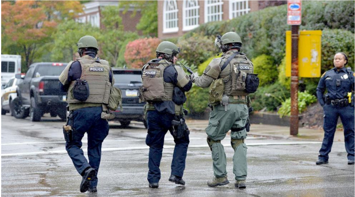
(Polizisten bereiten sich auf den Einsatz an der Synagoge vor. 14 )

Nach den Amokläufen und Attentaten in Aurora, 9 Newtown 10 und San Bernardino, 11 die mit Gewehren des Typs AR-15 (bzw. deren Derivaten) verübt wurden, die als halbautomatische Version des M16 bezeichnet werden können, rückten diese Waffen ins Zentrum des öffentlichen Interesses. Rufe nach strengerer Regulierung des privaten Erwerbs von fälschlicherweise als „Sturmgewehre“ bezeichneten Waffen wurden lauter. Insbesondere nach den Vorfällen in Orlando 12 forderten Präsident Obama sowie andere demokratische Politiker eine Neuauflage des landesweiten Verbots von „besonders gefährlichen“ halbautomatischen Waffen ... Hinzu kommt der "Amoklauf" an der Marjory Stoneman Douglas Highschool. 13